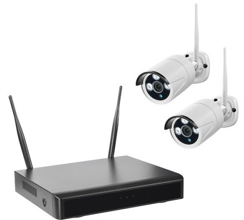
WR100 SET B2 4TB

Kameras der WR100/WR120-Serie, WLAN-Repeater/Access Point WR100E, Antennen-Verlängerungskabel DWAK-3M, DWAK-6M sowie DC-Verlängerungskabel DC10