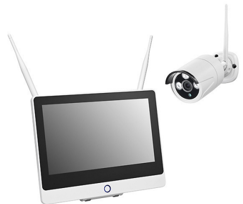
WR100 SET MB 1TB

Kameras der WR100/WR120-Serie, Anschlusskasten AK50/ AK208 für WR100B, WLAN-Repeater/Access Point WR100E, Antennen-Verlängerungskabel DWAK-3M sowie DWAK-6M